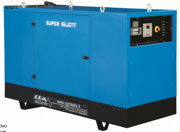
Le immagini sono puramente a titolo dimostrativo The images are only for demonstration purposes Cettes images sont utilisées uniquement à des fins de démonstration